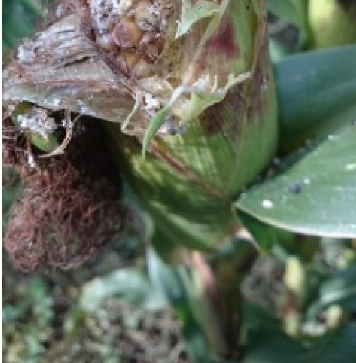
Billede 1. Angreb efter majshalvmøllarve i majscolbe fotograferet primo september.