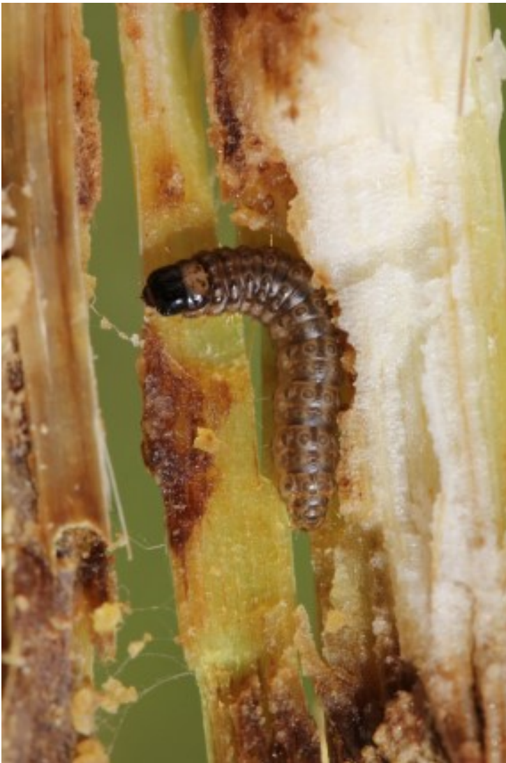
Billede 3. Majshalvmøllarve.