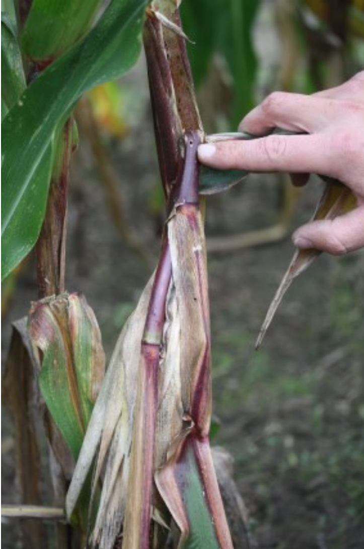
Billede 4. Knækket stængel grundet angreb af majshalvmøllarve.

Kontakt din lokale rådgivningsvirksomhed , hvis du vil vide mere om dette emne.