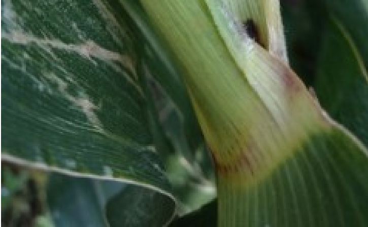
Billede 2. Angreb efter majshalvmøllarve i majsstængel fotograferet primo september.